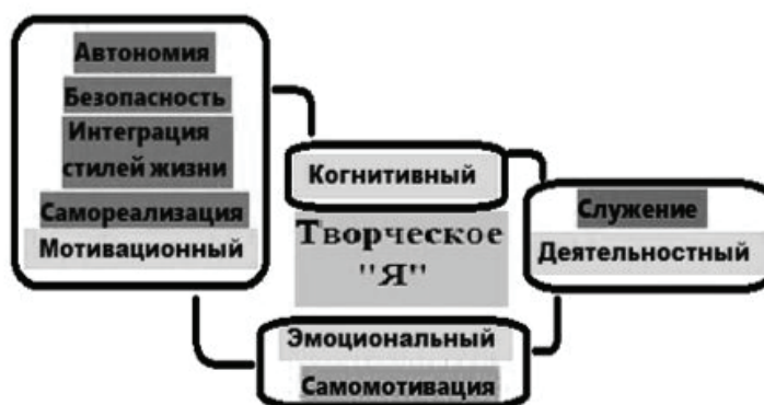
Рис. 3. Особенности структуры творческого «Я» личности курсантов образовательных организаций МВД России (будущих психологов органов внутренних дел)

Далее были выявлены особенности структуры творческого «Я» личности курсантов образовательных организаций МВД России с учетом специфики будущей профессиональной деятельности (Рис. 3 и 4).