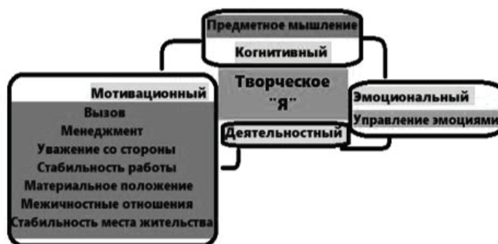
Рис. 4. Особенности структуры творческого «Я» личности курсантов образовательных организаций МВД России (будущих оперативных сотрудников полиции)

Деятельностный компонент включает составляющую «Служение», которая означает желание курсантов трудиться на благо своего дела, быть полезным и нужным. Добросовестно исполнять свои служебные обязанности, брать на себя ответственность, а также выполнять любые поручения, которые входят в их полномочия.