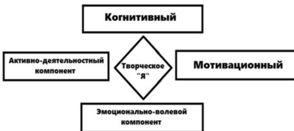
Рисунок 1. Теоретическая структура творческого «Я» личности

На рисунке 1 представлена структура творческого «Я» личности, основанная на анализе научных положений.