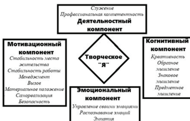
Рис. 2. Общая структура творческого «Я» личности курсантов образовательных организаций МВД России

на данном этапе профессиогенеза выражается через «Служение» и «Профессиональную компетентность».