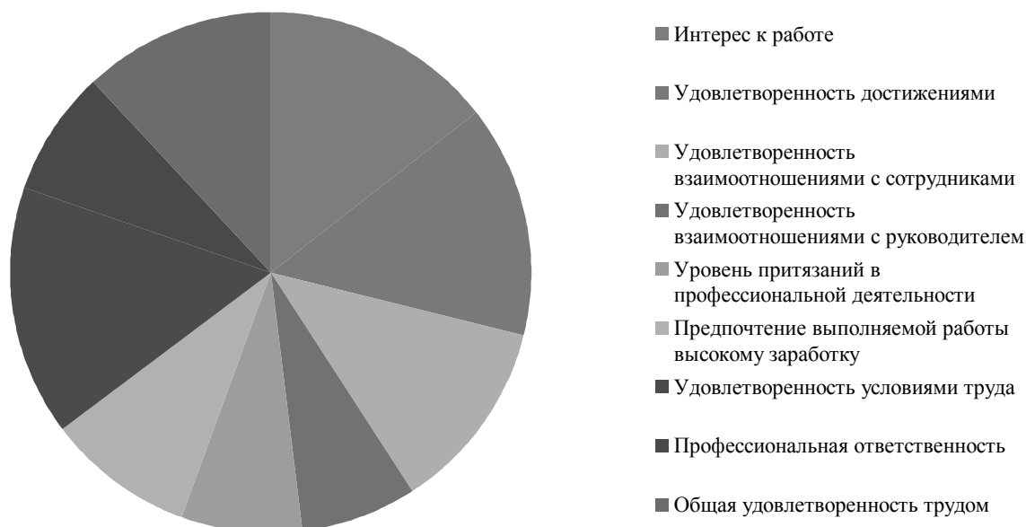
Рис. 1. Выраженность компонентов удовлетворенности трудом у следователей органов внутренних дел