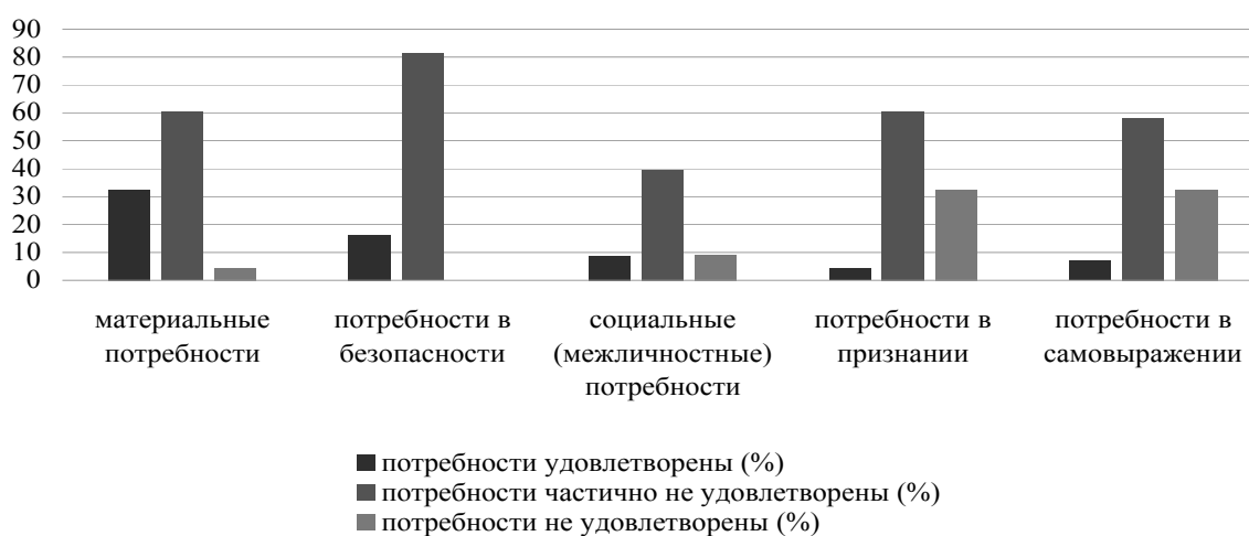
Рис. 2. Выраженность удовлетворенности потребностей следователей органов внутренних дел